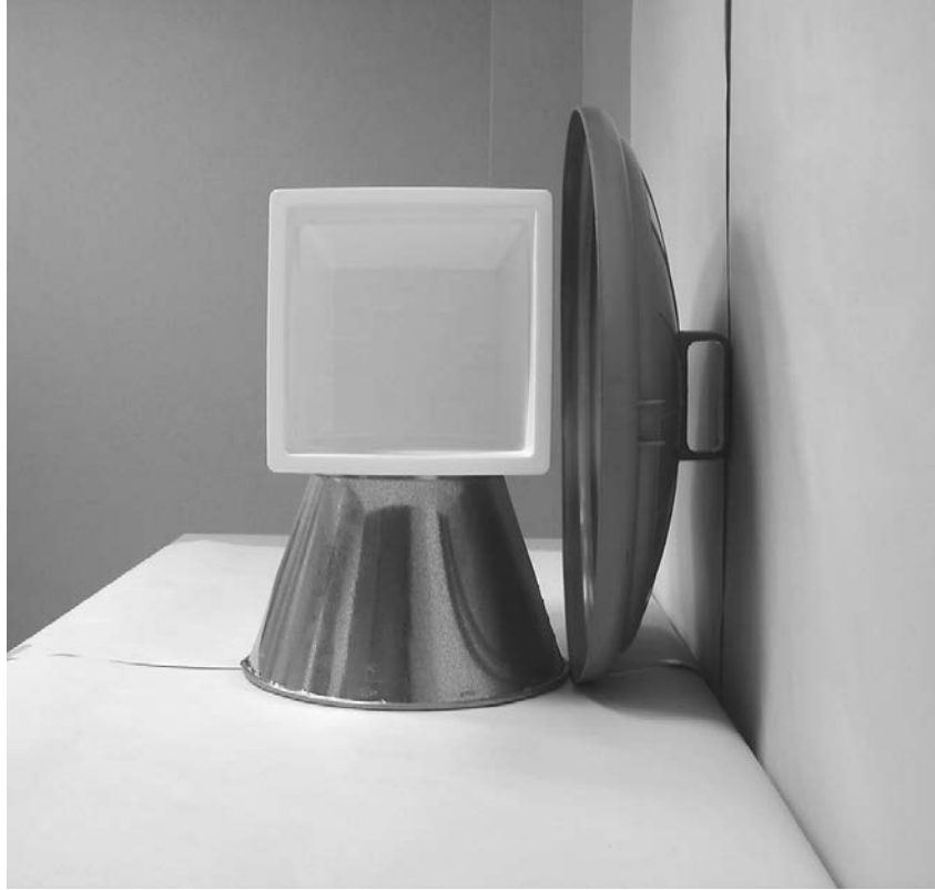
Τρίτη φωτογραφία : Πλάγια όψη