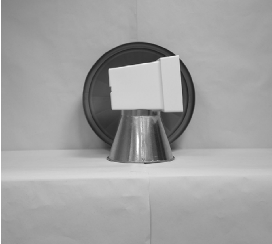
Πρώτη φωτογραφία : Μπροστινή όψη