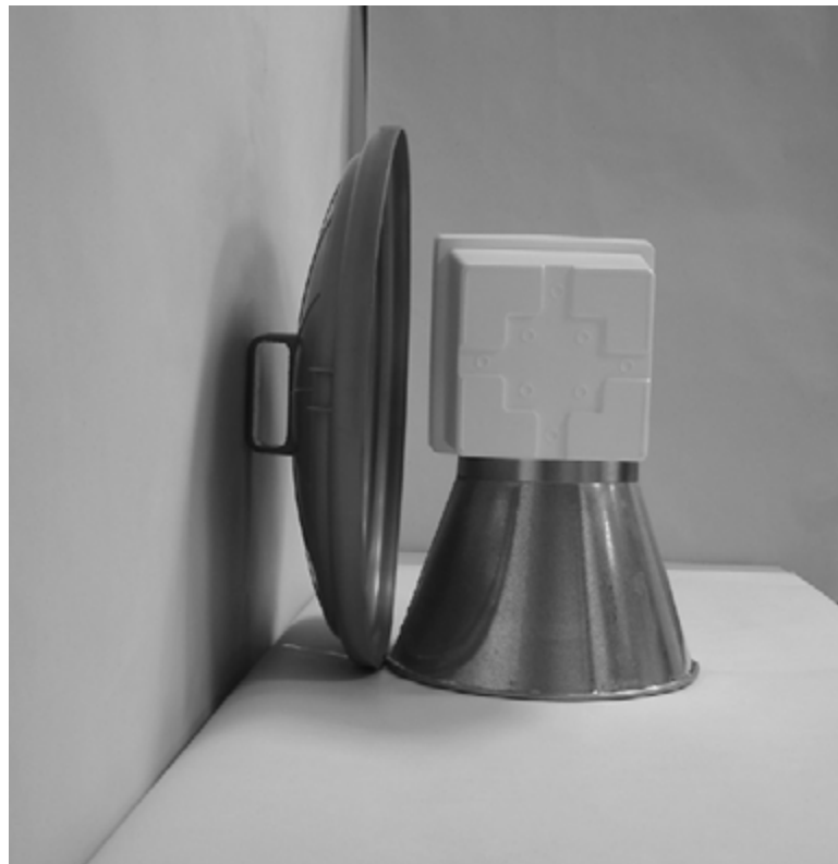
Τέταρτη φωτογραφία : Πλάγια όψη